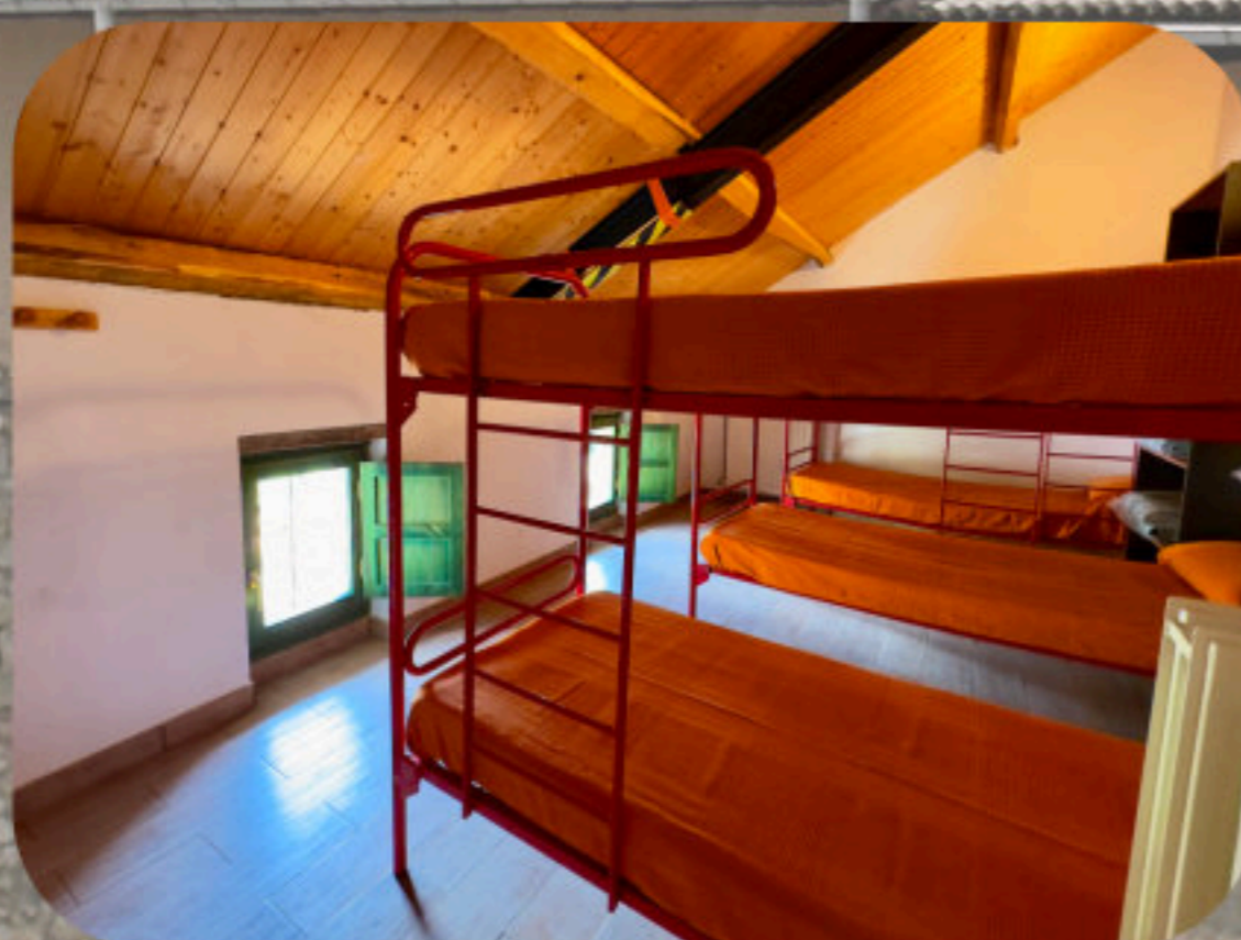
Habitaciones 3º piso