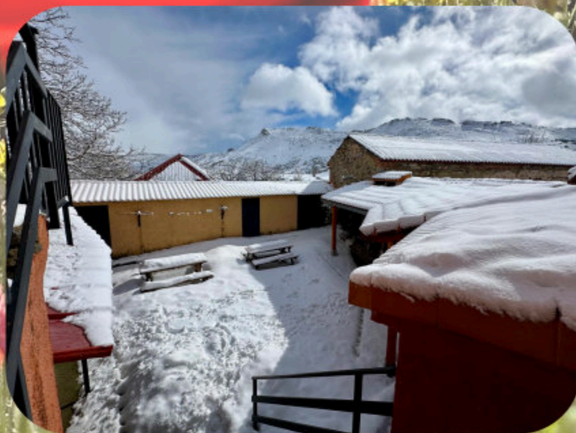
Patio en invierno