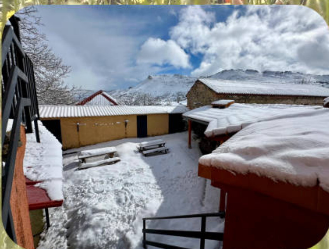
Patio en invierno