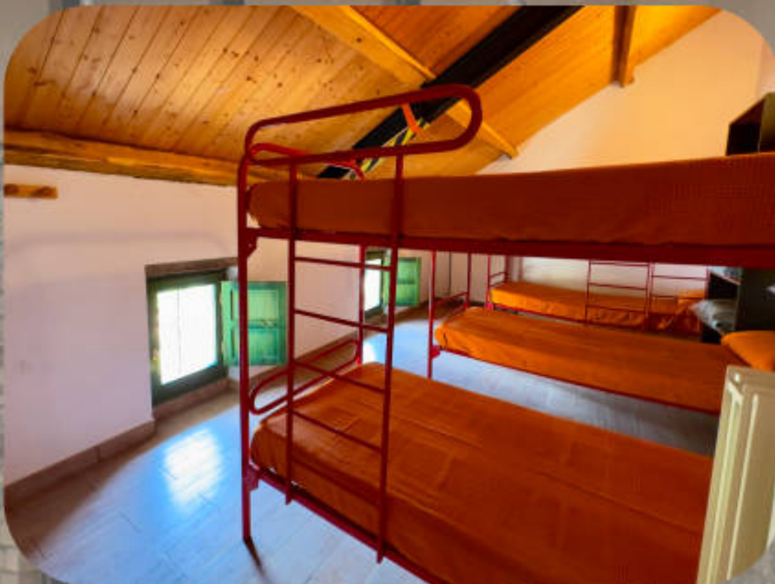
Habitaciones 3º piso