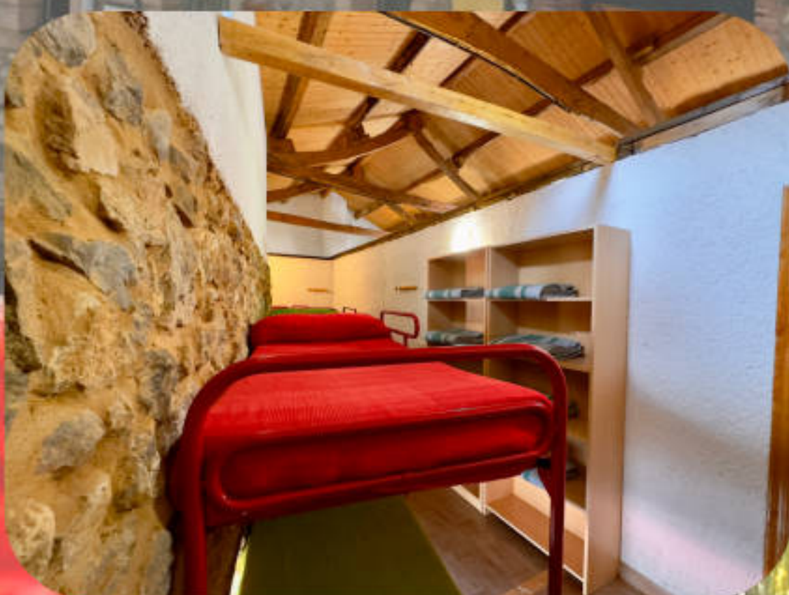
Habitaciones 2º piso